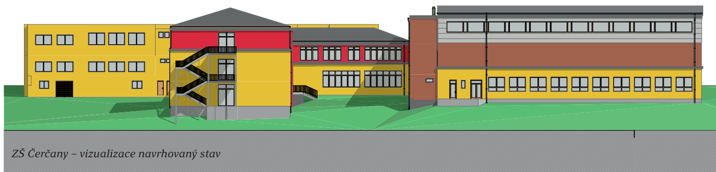
ZŠ Čerčany – vizualizace navrhovaný stav