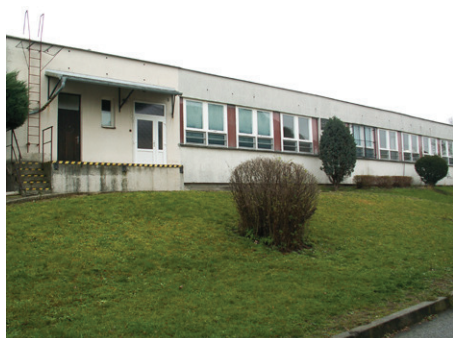
ZŠ Čerčany – současný stav

Město Týnec nad Sázavou pak ze stejného programu ministerstva financí získalo celkovou dotaci ve výši 18,5 milionu korun na přístavbu Základní školy Týnec nad Sázavou. I v tomto případě se jedná o dvouletý projekt, který bude dokončen v příštím roce.